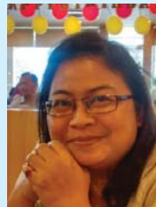
Maria Regina RB